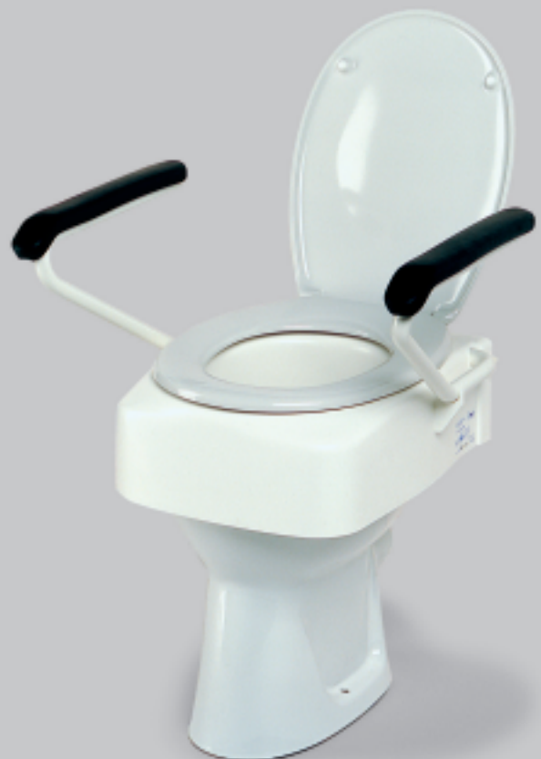
Toilettensitzerhöhung mit Armlehnen

Toilettensitzerhöhungen stehen in unterschiedlichen Höhen (8, 12, 16 cm) zur Verfügung; einfache Ausführungen werden mit Hilfe von Befestigungsklemmen direkt am Beckenrand fixiert. Höherwertige Produkte verfügen beispielsweise über integrierte Armlehnen und werden statt an der Toilettenbrille sicher in den dafür vorgesehenen Halterungen fixiert.