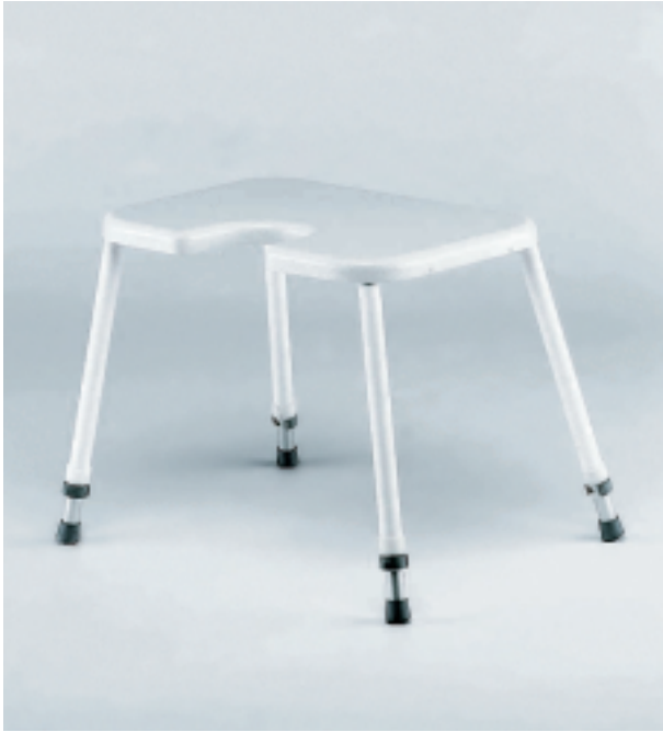
Duschhocker ohne Armlehnen mit Hygieneaussparung