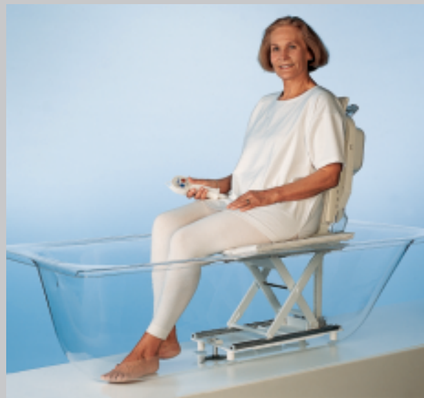
Akkubetriebener Badewannenlifter mit Drehhilfe

Sitzfläche und Seitenklappen sind mit einem rutschfesten, waschbaren Bezug verkleidet. Je nach Modell kann die Rückenlehne über die leicht bedienbare Steuerung komplett nach hinten abgesenkt werden, so dass ein Vollbad möglich ist. Beim Übersetzen vom Rollstuhl auf den Badewannensitz (und umgekehrt) erleichtern passende Drehhilfen den Transfer.