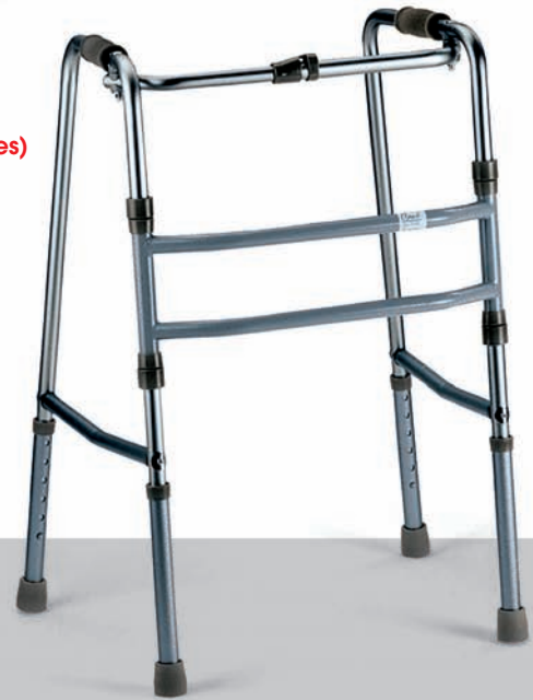
Reziprokes (bewegliches) Gehgestell